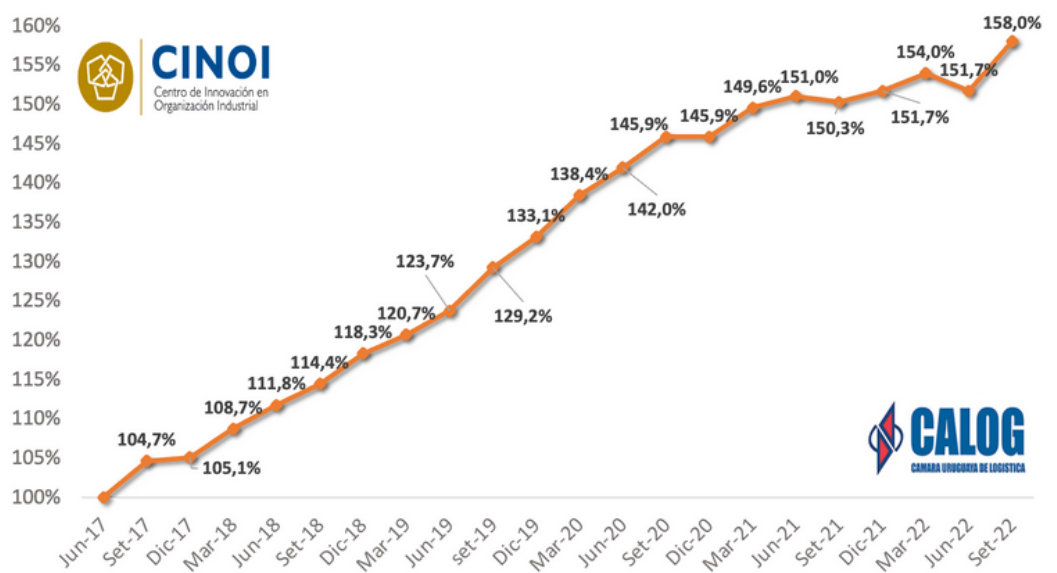
EVOLUCIÓN DEL ÍNDICE EN EL PERÍODO JUN/17 - SET/22

Finalmente, en cuanto a la distribución por rubro, con respecto al trimestre anterior, el personal y el mantenimiento aumentaron, mientras que las amortizaciones y la energía descendieron.