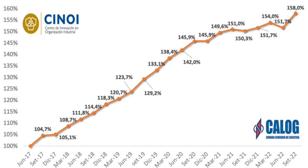
EVOLUCIÓN DEL ÍNDICE EN EL PERÍODO JUN/17 - SET/22

Finalmente, en cuanto a la distribución por rubro, con respecto al trimestre anterior, el personal y el mantenimiento aumentaron, mientras que las amortizaciones y la energía descendieron.